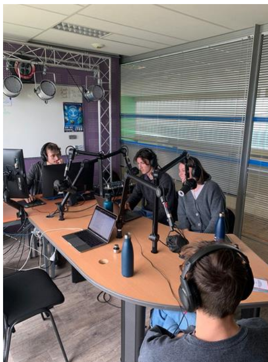
Enregistrement du podcast dans les locaux de l'association Le 3e Lieu

Au cours de nos parties de jeu, il est devenu clair que l'intérêt du jeu résidait principalement dans la capacité des joueur-euses à se projeter, à « créer des mondes » si l'on ose. Est donc venue l'idée de mettre en récit à la fois notre démarche propre, de la création du dispositif à l'interprétation des résultats, ainsi que les positions et visions exprimées. Le jeu vise ainsi à ouvrir le possible, et pour mieux rendre compte de la multicités des réponses, nous avons enregistré les participant-es. Pour mieux montrer la diversité des visions, nous avons en effet posé les deux mêmes questions à tous les participant-es à la fin de leur partie :