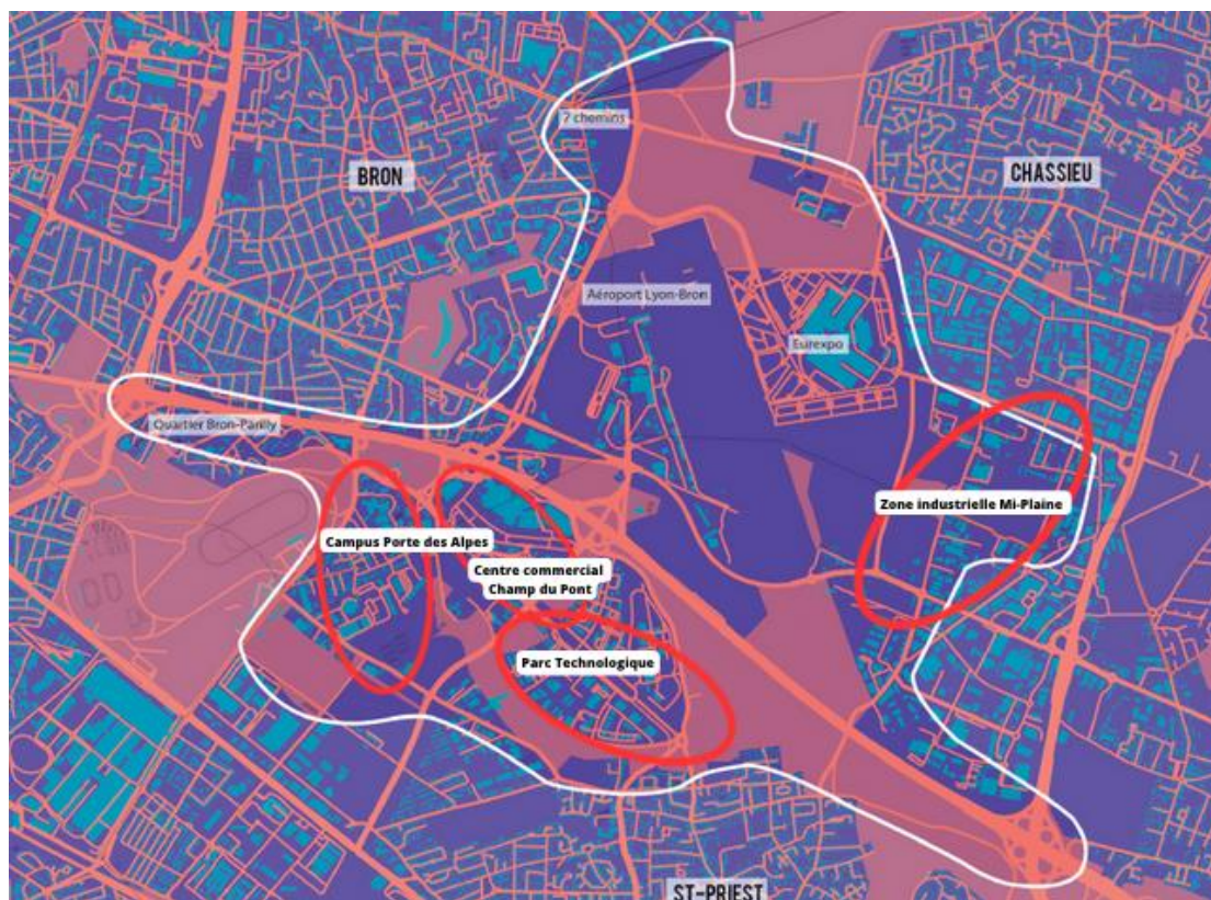
Carte de la Porte des Alpes et des entités observées