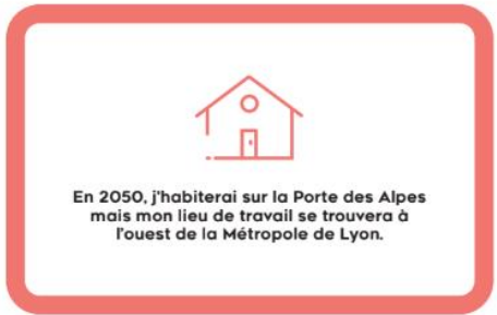
Première version (V1) des « cartes scénarios »

Ce choix de deux échelles de cartes permet une forme de projection dans un futur du territoire. Le jeu mobilise ainsi l'imagination, tout en posant certaines contraintes qui encouragent la réflexion (en poussant à créer des liens entre les cartes scénarios, et entre la carte paradigme et chaque scénario) sans la guider.