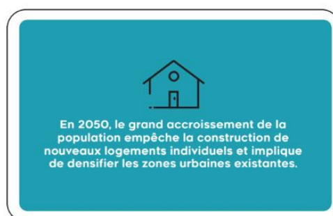
Première version (V1) des « cartes paradigmes »