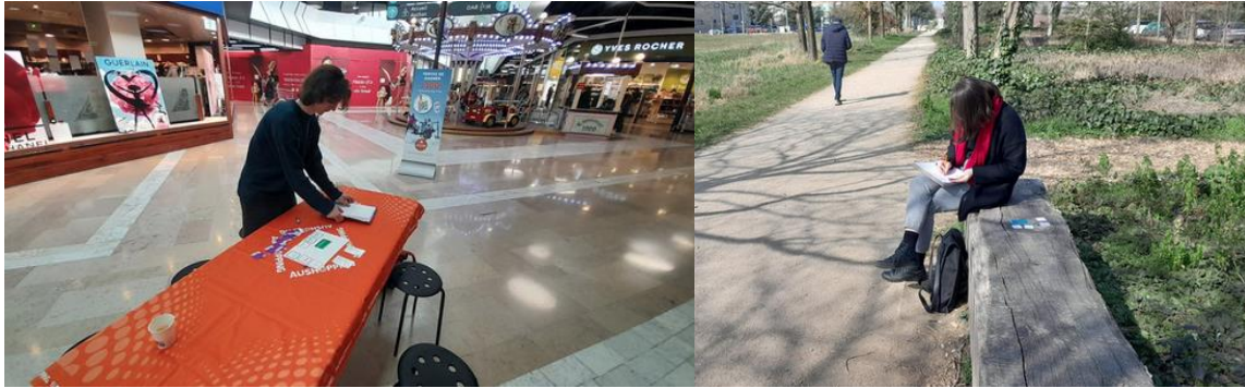
Lieux de test du dispositifs, au centre commercial (à gauche) et au Parc technologique (à droite)